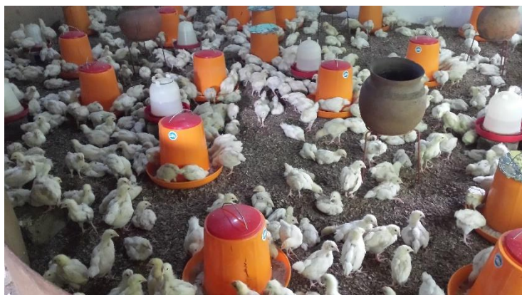
Elevage de coquelets de chair

Chaque semaine, les familles passent à tour de rôle à la ferme pour aider les moniteurs dans le soin des animaux.