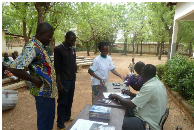
Signature des contrats à la fin de la campagne.

Toutes les familles ont reçu leur « cahier de suivi » avec leur projet d'installation. Nous considérons que ce cahier peut devenir un instrument pour rendre notre suivi plus efficace. Lors de nos visites nous demanderons le cahier pour comparer si les actions prévues ont été concrétisées. A la fin du rendez-vous, nous rédigerons, nous aussi, nos recommandations qui seront révisées à l'occasion de la prochaine visite.