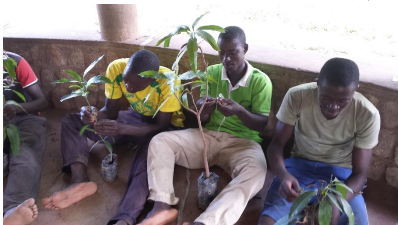
Greffage de manguiers

Étant donné le niveau de scolarisation assez faible des personnes dont nous avons la charge, nous proposons une formation essentiellement pratique, la même formation étant donnée aussi bien aux hommes qu'aux femmes : la préparation du sol, travail avec les bœufs, la "culture à plat". Nous avons poursuivi la formation à une agriculture plus respectueuse de l'environnement en leur faisant