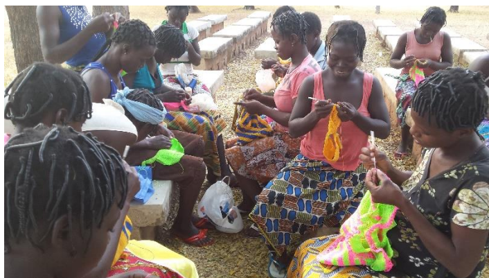
Cours de tricot

C'est la formation que nous considérons comme la plus importante. Chaque jour, au Centre, les activités sont réalisées conjointement par le couple. L'insistance que nous mettons à respecter la femme, à la participation de l'homme et de la femme aux travaux domestiques, tout ceci constitue une autre conception de la vie familiale que nous tenons à leur inculquer. Cette formation prend en compte tous les membres de la famille :