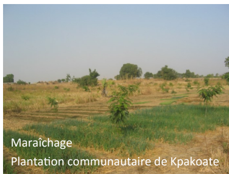
Maraîchage Plantation communautaire de Kpakoate

L'intensité de l'activité de S.M. et de ses pépiniéristes l'ont poussé à organiser son travail par secteur (5) avec un responsable pour chacun.